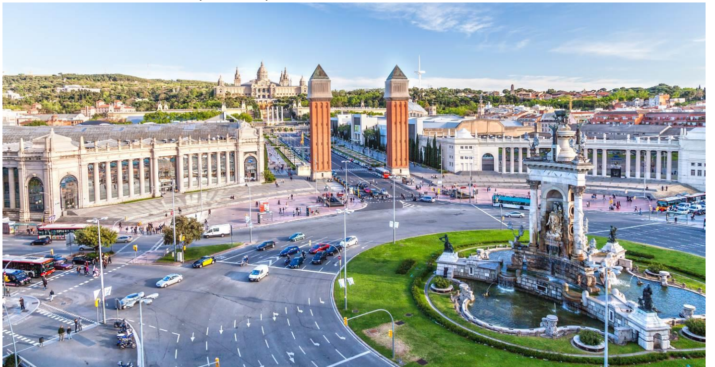
เมืองบาร์เซโลนา ประเทศสเปน โทร 0034 93 430 00 00 โทร 0034 93 430 00 00

00.15 น. นำท่านเดินทางสู่ ท่าอากาศยานนานาชาติบาร์เซโลนา เมืองบาร์เซโลนา ประเทศสเปน โดยสายการบิน Cathay Pacific Airways เที่ยวบินที่ CX321 ** ใช้เวลาบินประมาณ 13 ชั่วโมง 40 นาที บริการอาหารและเครื่องดื่มบนเครื่องบิน ** 06.55 น. เดินทางถึง ท่าอากาศยานนานาชาติบาร์เซโลนา เมืองบาร์เซโลนา ประเทศสเปน นำท่านผ่านพิธีการตรวจคนเข้าเมืองและศุลกากร ** เวลาท้องถิ่นช้ากว่าประเทศไทยประมาณ 5 ชั่วโมง ** นำท่านเดินทางสู่ เมืองบาร์เซโลนา (Barcelona) เมืองหลักของแคว้นกาตาลุญญา และเป็นเมืองใหญ่อันดับสองทั้งในด้านขนาดและประชากรของประเทศสเปน ตั้งอยู่บนชายฝั่งทะเลเมดิเตอร์เรเนียนของคาบสมุทรไอบีเรีย เป็นเมืองเก่าแก่ที่มีประวัติศาสตร์อันยาวนาน เคยเป็นอาณานิคมของโรมันมาก่อน เคยถูกยึดครองโดยชาติต่างๆหลายครั้ง รวมทั้งประเทศฝรั่งเศสเมื่อปี ค.ศ. 1640 เมืองบาร์เซโลนาเป็นเมืองที่มีชื่อเสียงด้านการท่องเที่ยว โดยเฉพาะการท่องเที่ยวยามราตรีที่รื่นเริงสนุกสนาน มีสถาปัตยกรรมเก่าแก่ที่สำคัญมากมาย เคยเป็นเจ้าภาพจัดการแข่งขันกีฬาโอลิมปิกครั้งที่ 22 และเมื่อปี ค.ศ. 1888 เคยเป็นที่จัดงานแสดงสินค้าโลก (World's Fair)